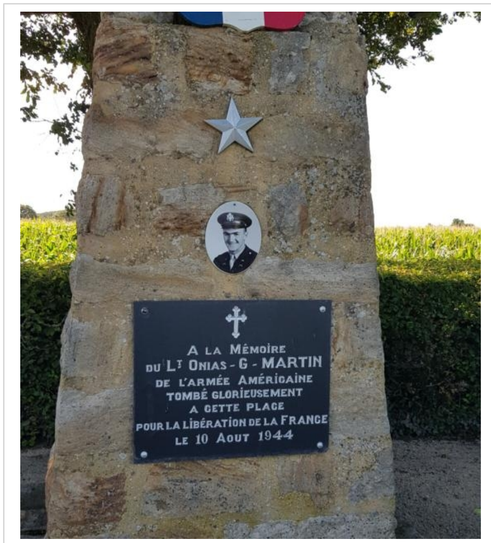
Une cérémonie aura lieu au monument Onias Martin.

À 19 heures, la journée se conclura par un vin d'honneur à la salle Mélusine, offrant aux participants l'occasion de se retrouver et d'échanger sur les moments forts de cette célébration.