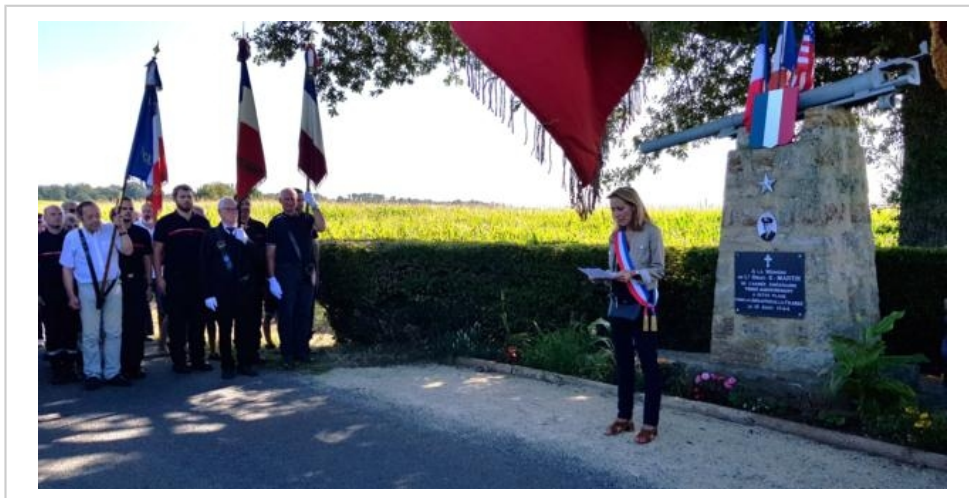
Messe, repas champêtre, véhicules militaires, cérémonies ; Bonnétable va dignement célébrer les 80 ans de la libération.