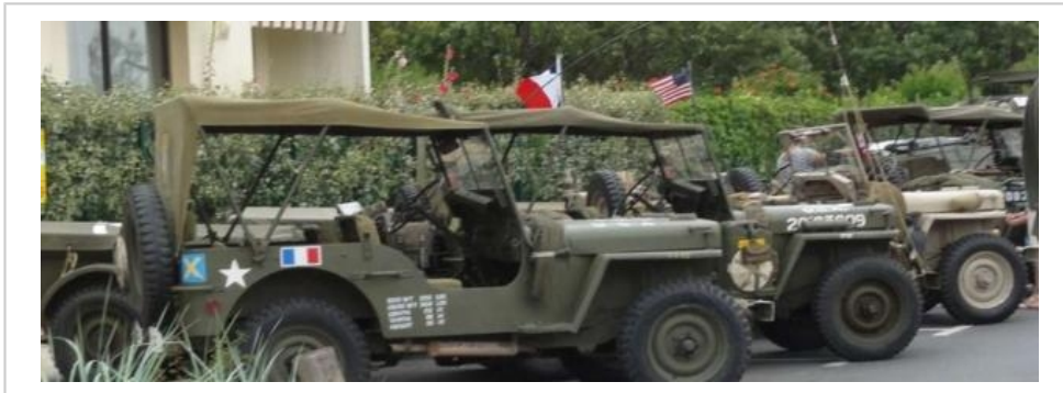
Des véhicules militaires circuleront à partir de 16 h lors de la journée de mémoire.

Samedi, entrée libre sauf repas (sur réservation). Renseignements : tel. 02 43 29 30 20