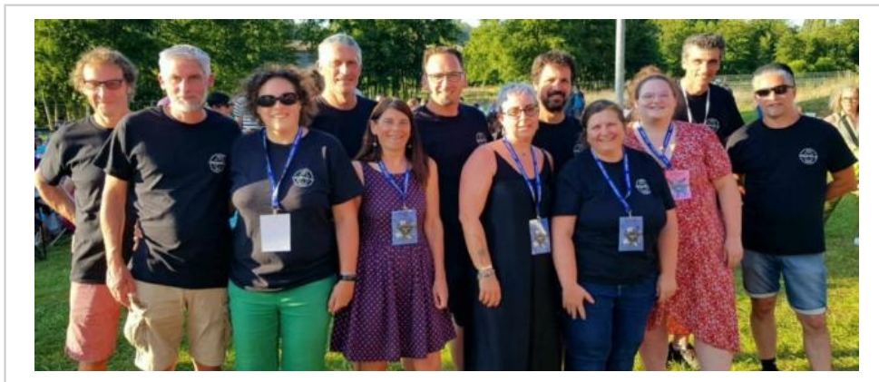
L'équipe du Collectif 110 rayonne au cœur de la Bonn'Zik, un festival couronné de succès grâce à leur énergie et leur passion.

Le succès de cette édition repose également, comme depuis sa création sur un soutien local important. Le Collectif 110 tient à partager cette réussite avec, les 25 associations de Bonnétable, les artisans et partenaires présents tout au long du festival, ainsi que la municipalité et la communauté de communes. « Tous ont joué un rôle essentiel dans la réalisation de cette saison. » Le président du Collectif 110, conclut : « Le festival se veut familial et accessible à tous, offrant un cadre convivial où chacun peut profiter de la musique. Voir les festivaliers danser et prendre du plaisir est une grande satisfaction pour toute l'équipe. Nous sommes fiers du travail accompli et dès la rentrée, nous commencerons à préparer la prochaine saison pour offrir encore plus de moments inoubliables avec de nouveaux artistes. »