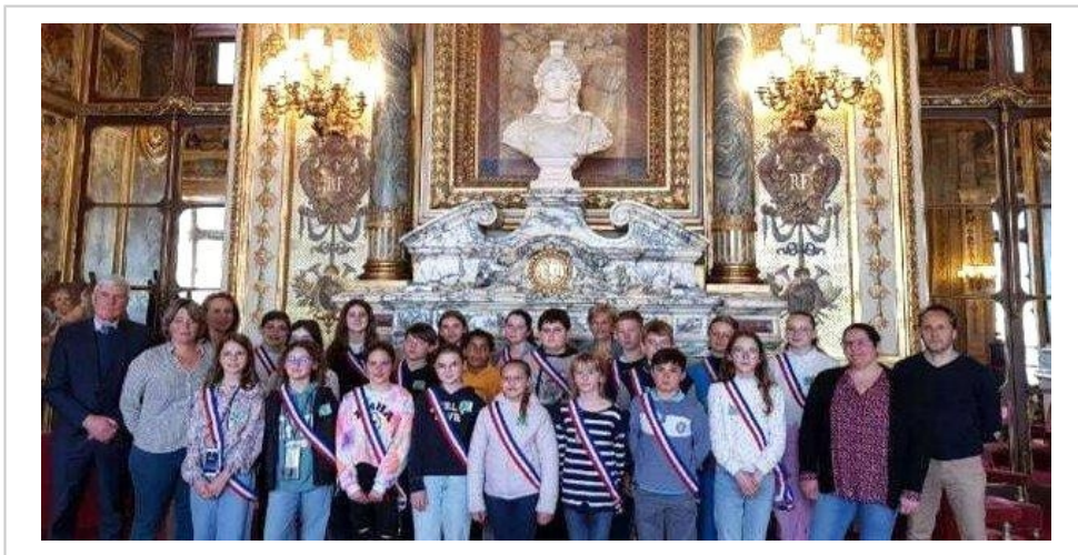
Beaucoup de fierté et de bonheur pour les membres du CMJ de Bonnétable lors de leur visite au Sénat.

Le retour à Bonnétable s'est fait aux alentours de 18 h, les jeunes conseillers rapportant avec eux des souvenirs plein la tête. « Cette journée exceptionnelle a été une belle récompense pour leur engagement au sein de la municipalité. Une aventure éducative et ludique qui restera sans doute un moment fort de cette année. »