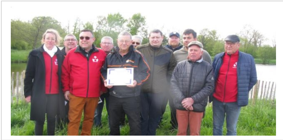
L'école de pêche a reçu une subvention de 800 €.

Le club a donc reçu une subvention de 800 € d'une banque locale, pour pouvoir investir dans du matériel nécessaire. Les cours sont dispensés dans les rivières l'Huisne, la Sarthe et l'Orne Saosnoise ainsi que dans les plans d'eau du secteur de La Ferté-Bernard, Tuffé, Connerré ou Fillé.