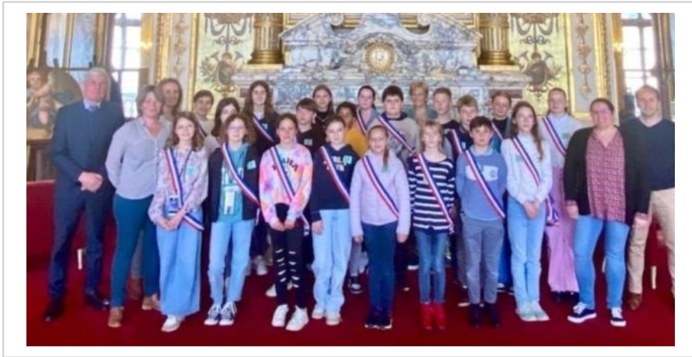
Les 21 conseillers jeunes de Bonnétable ont été reçus au sénat par Jean-Pierre Vogel.

Après un départ à 7 heures, le retour à Bonnétable a eu lieu à 18 heures pour les conseillers, et avec des souvenirs plein la tête !