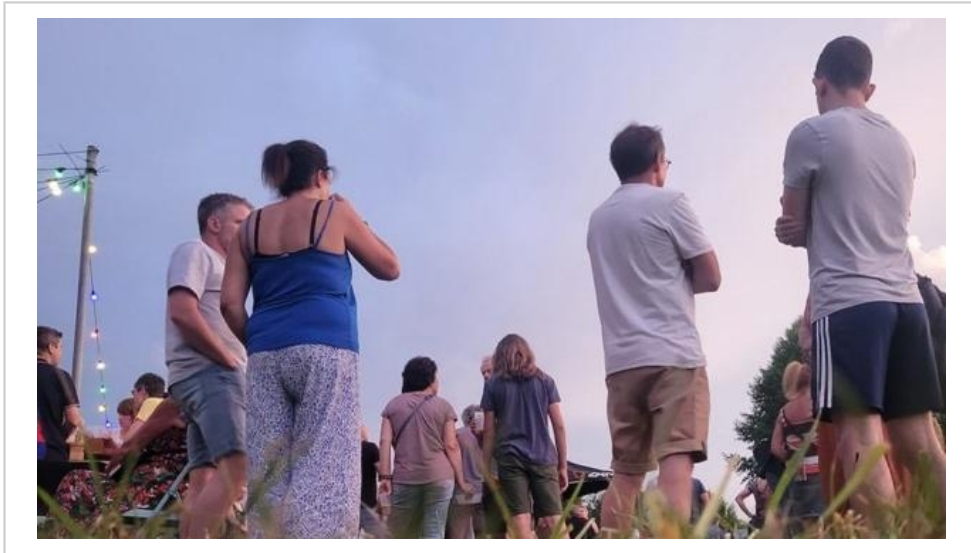
Le festival La Bonn'Zik sera de retour, le vendredi 28 juin, dans le parc du Château de Bonnétable.