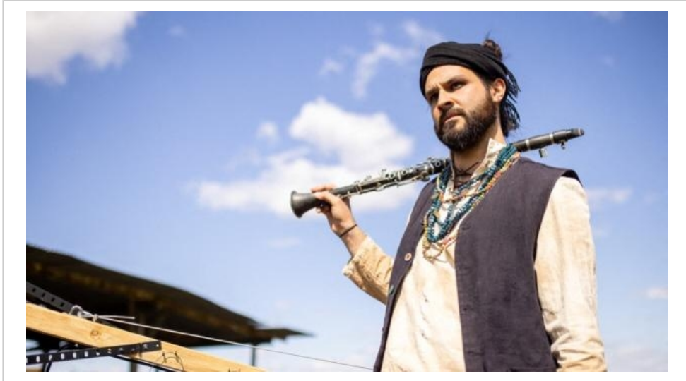
SolOrkestar assurera deux représentations, à 14h30 et 16h, ce dimanche 5 mai 2024, au jardin potager de Bonnétable, à l'occasion de son marché de printemps.

Ce dimanche 5 mai 2024, le Jardin potager de Bonnétable (Sarthe) fait son traditionnel marché de printemps. De nombreux exposants, artistes et artisans sont attendus.