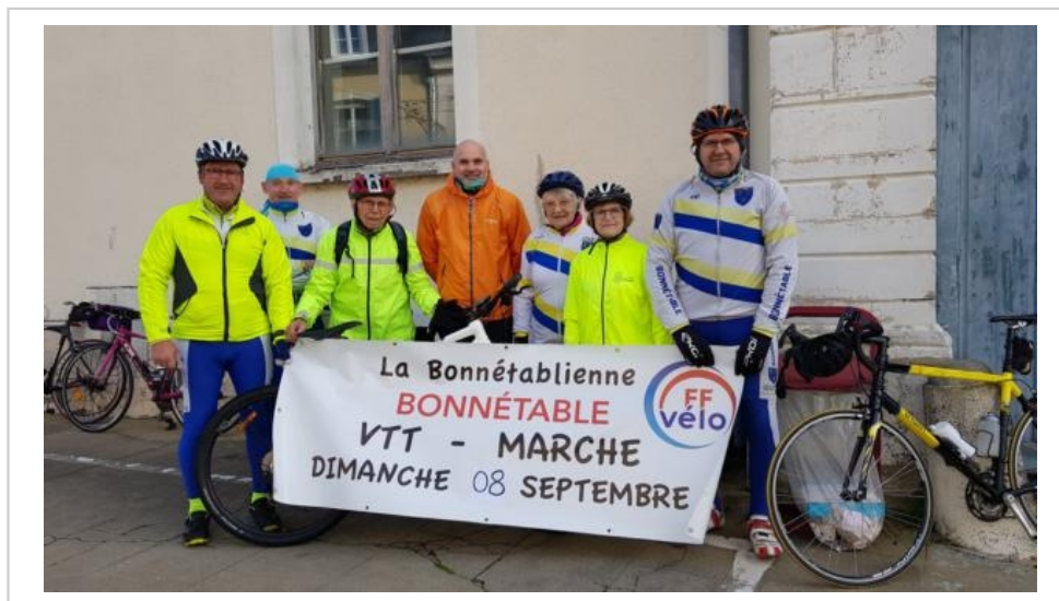
Avec 40 ans d'existence, le club de Bonnétable représente une tradition cycliste bien ancrée.