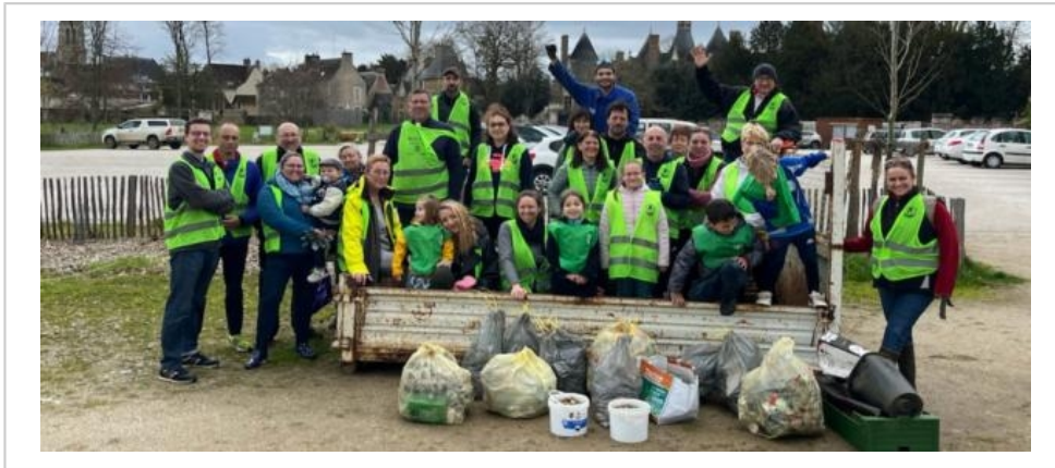
L'équipe Bonn'actions et Qui nettoie si ce n'est toi ? ont célébré une journée pleine d'accomplissements lors du Printemps Propre à Bonnétable.

Facebook : Bonn'Actions. Site web : colibris-wiki.org/bonnactions . « Qui nettoie si ce n'est toi », rendez-vous sur Facebook : Wings of the Ocean.