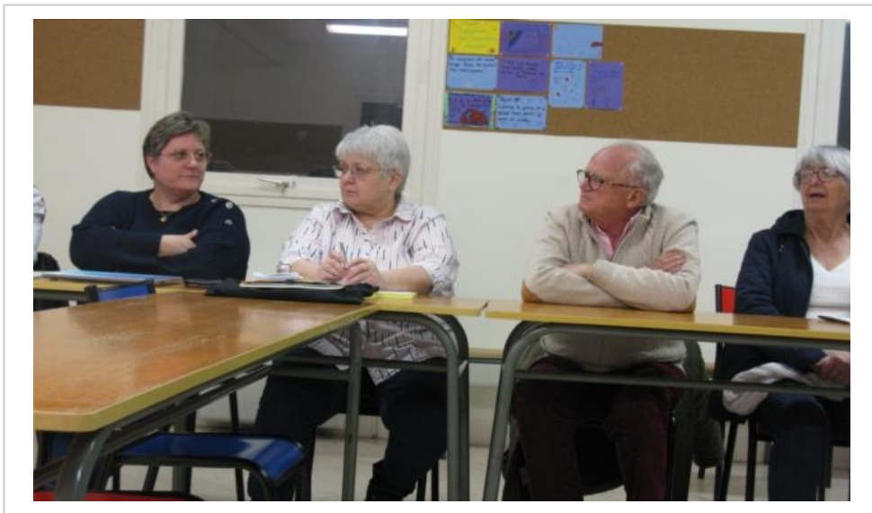
Les membres du bureau ont animé l'assemblée générale des Amis des orgues.

« Pour les mariages, il sera possible de demander un accompagnement à l'orgue de l'église », a rappelé le président.