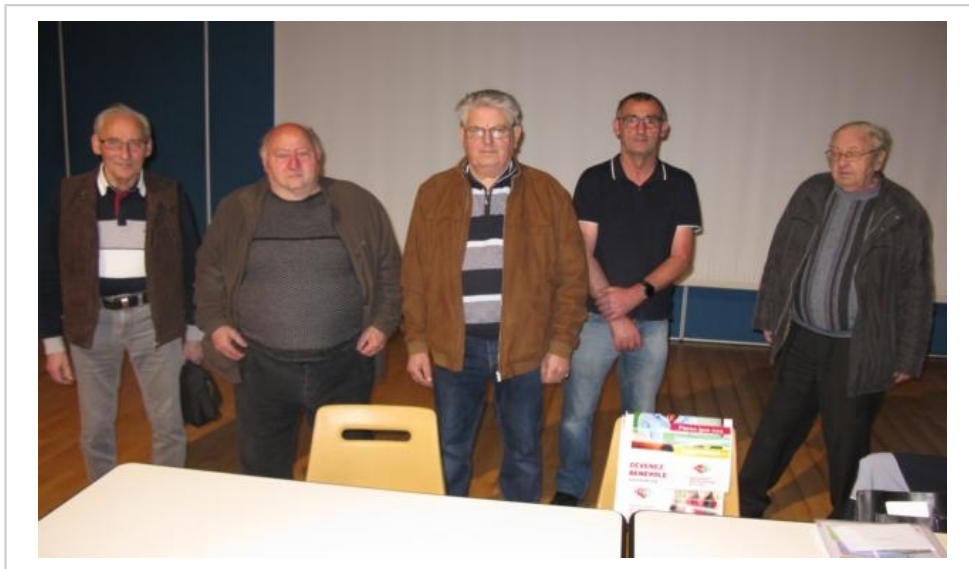
Les membres de la Fédération nationale des accidentés du travail et handicapés (Fnath).