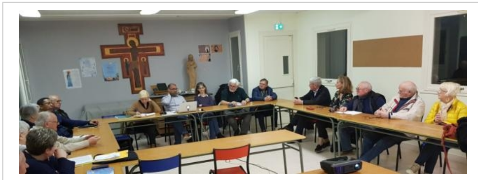
Une assemblée générale en l'église Saint-Sulpice.

Contact : assoaspb@gmail.com ou par téléphone au 06 89 90 91 83