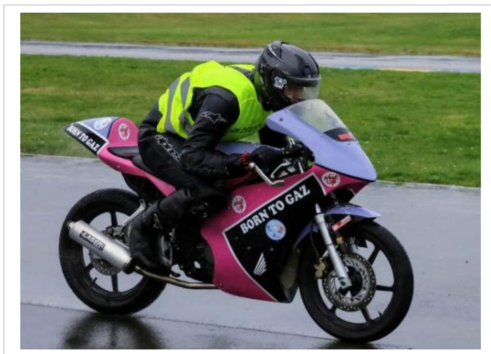
La moto de la Team aux couleurs d'Anaïs (association Princesse Anaïs de Thorigné-sur-Dué).

Contact : 06 41 83 04 75 ou 06 13 12 33 08.