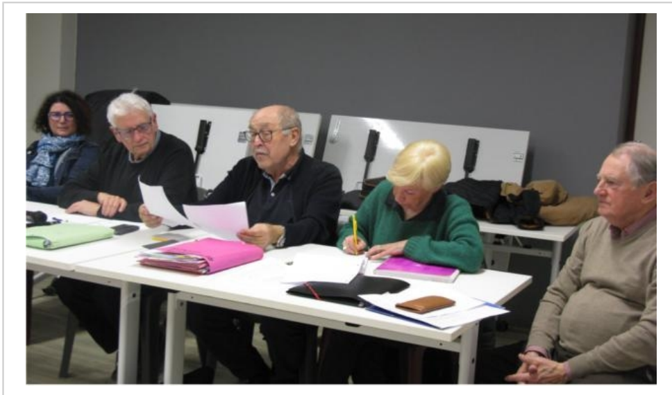
L'association culturelle a tenu son assemblée générale, vendredi.

Contact. Page Facebook Association culturelle intercommunale à Bonnétable.