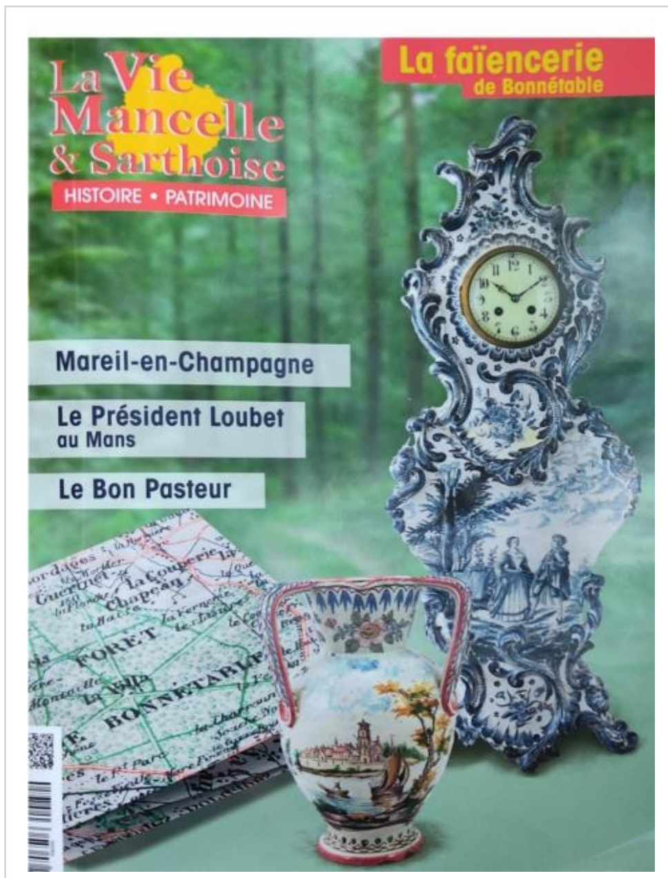
Dans ce nouveau numéro, cinq pages sont consacrées à la faïencerie de Bonnétable.

La Vie mancelle et sarthoise , n° 482, mars 2024, 6,80 €.