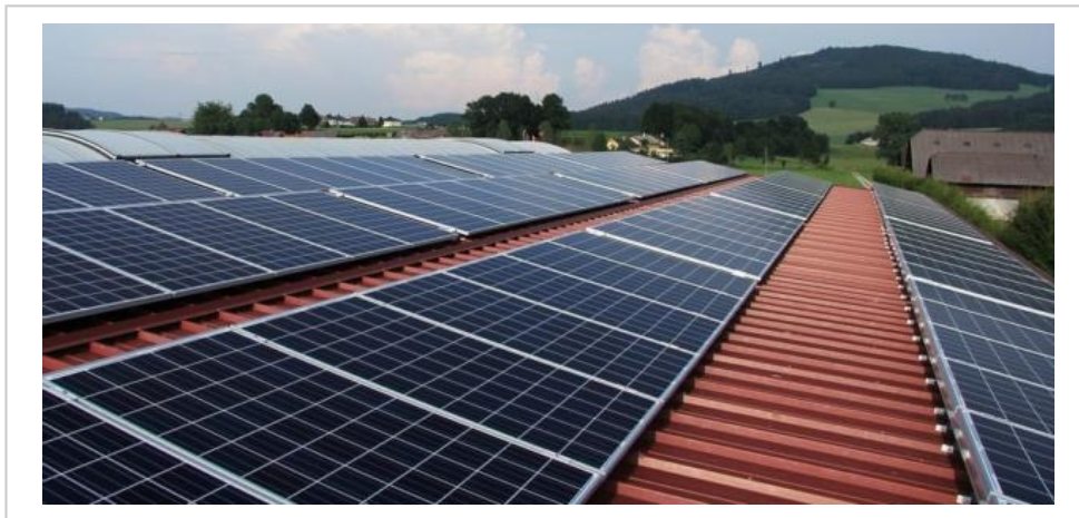
Le conseil entérine les zones d'accélération.