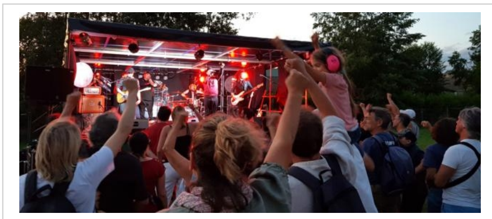
Début de la 5e édition de ce festival, le vendredi 28 juin 2024.

Pour la dernière date, le 26 juillet, Grisby Band et Bastringue General.