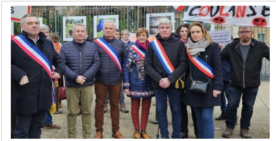
Les élus se mobilisent pour préserver leurs écoles publiques.

En conclusion, la maire a demandé « un sursis au vu du nombre d'élèves manquants, soulignant l'importance d'une mobilisation commune pour attirer davantage d'enfants dans notre belle école publique. »