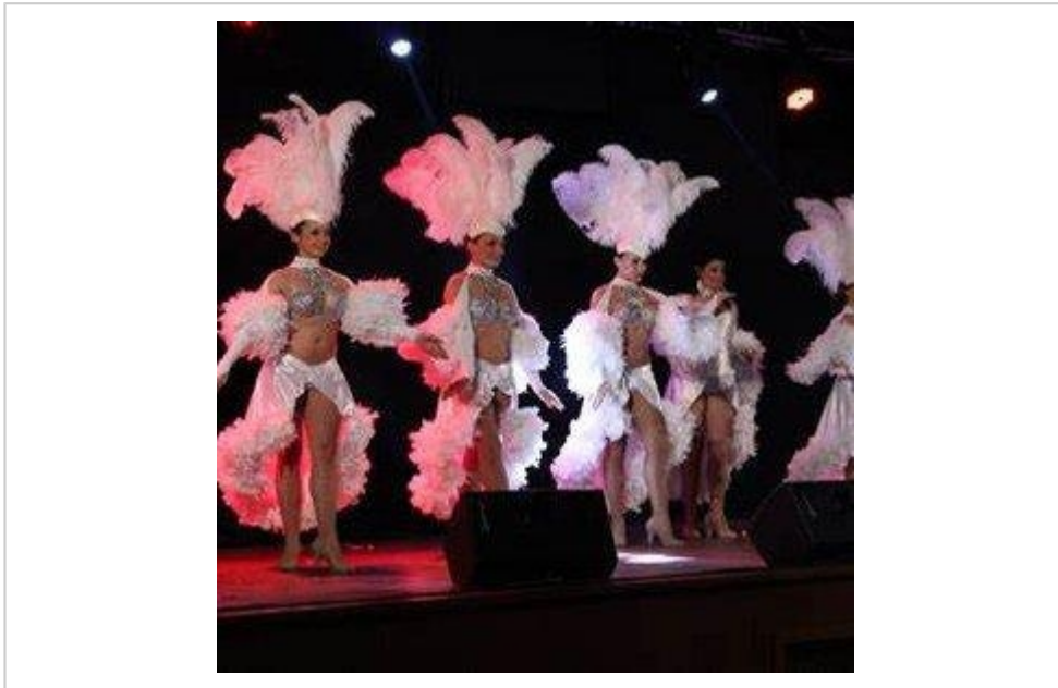
La troupe de cabaret sur scène.