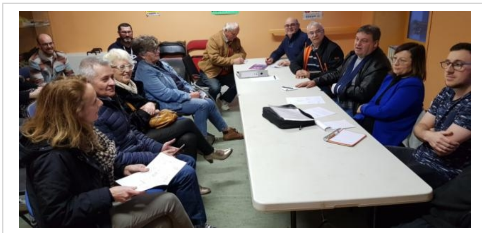
L'équipe du comité des fêtes a dévoilé le programme 2024.