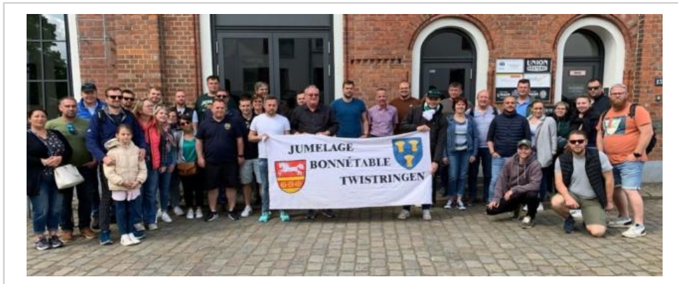
Le comité de jumelage Bonnétable-Twistringen, compte sur votre générosité et votre ouverture d'esprit.