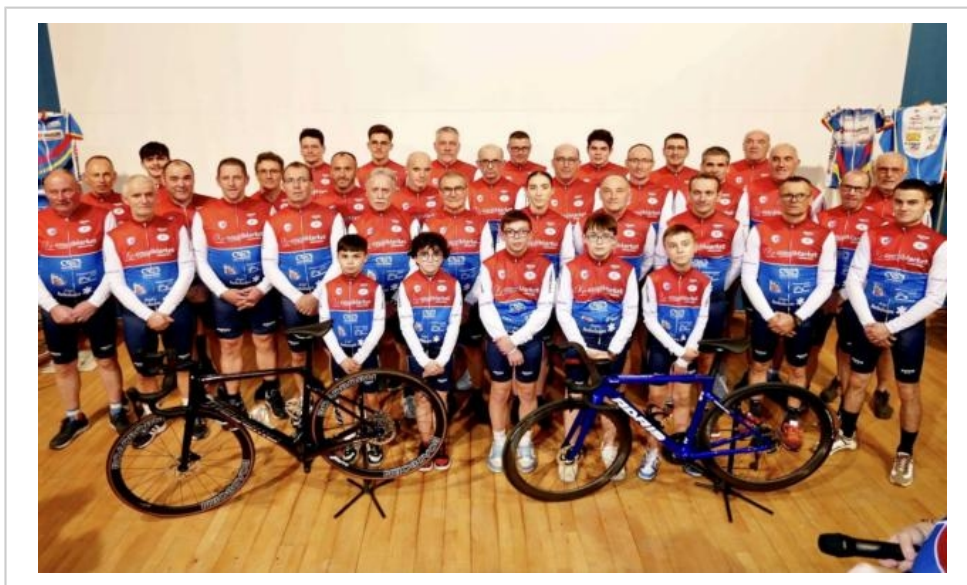
Les 43 compétiteurs du club réunis sur une même image.

Au cours de la présentation, le président a également glissé une information concernant le passage du Région Tour Pays de la Loire en 2024. Une récompense pour le club et ses bénévoles qui pourront voir ce qui se fait de mieux dans le peloton international, avec plusieurs équipes World Tour et Continental. L'étape partira de Marolles-les-Braults et se terminera au Mans. Le parcours précis n'a pas encore été dévoilé.