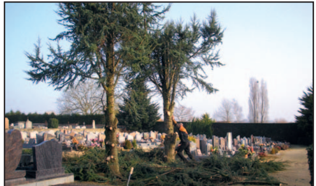
Abattage de deux arbres au cimetière