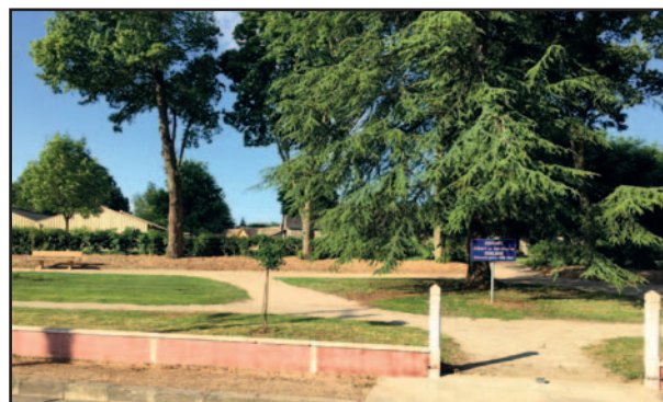
Le square Guilmin réhabilité