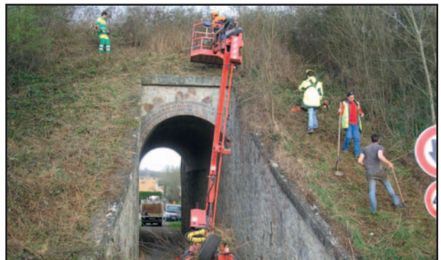
Pont de pierre élagage en collaboration avec la Transvap