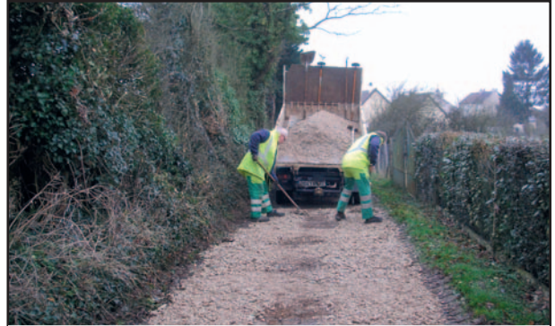
Encassement dans un chemin