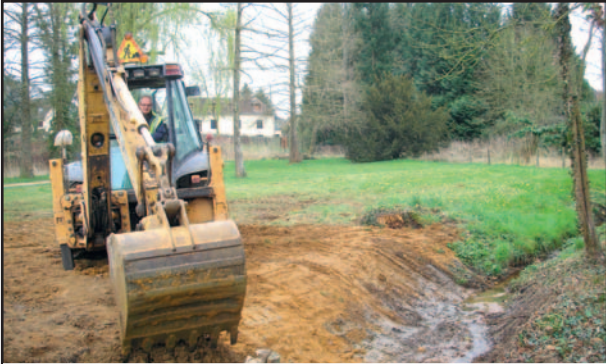
Busage et curage d'un fossé dans le jardin public