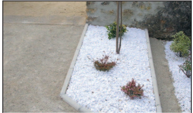
Création de parterre cimetière