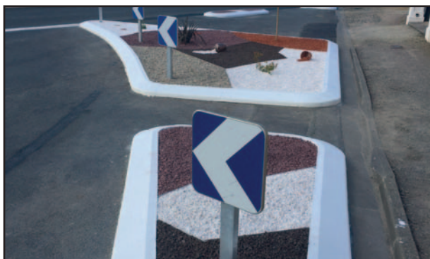
Aménagement du terre-plein, Avenue du 8 Mai