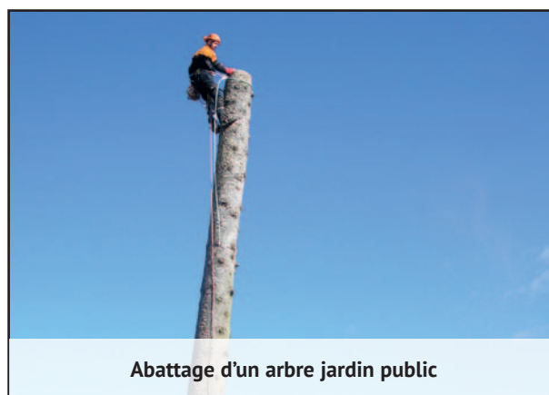
Abattage d'un arbre jardin public