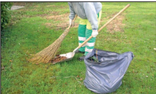
Ramassage de crottes de chiens au jardin public et trottoirs