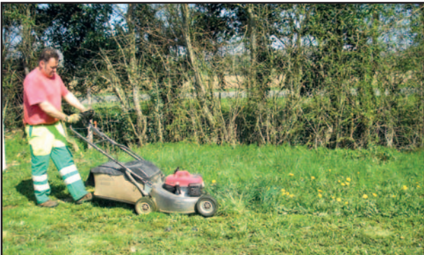
Tonte à l'aire d'accueil des gens du voyage