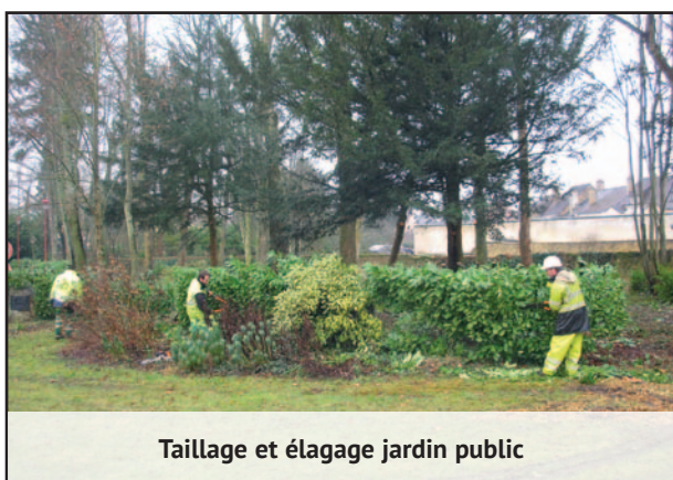
Taillage et élagage jardin public