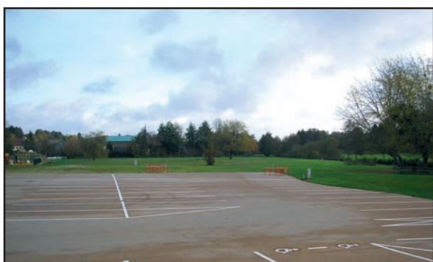
Marquage au sol du parking face au château