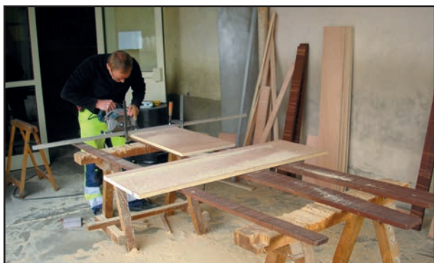
Découpe pour des étagères dans une classe à l'école élémentaire