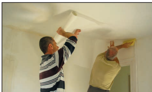
Rénovation et peinture dans le bâtiment RASED à l'école élémentaire