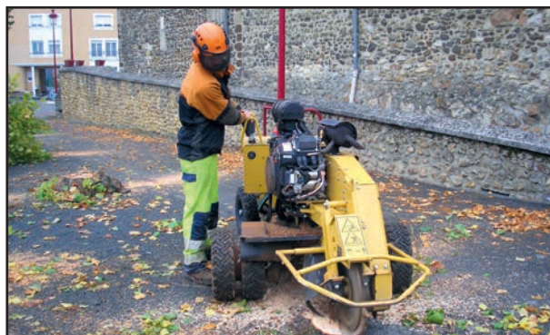
Abattage des arbres du parking de l'église