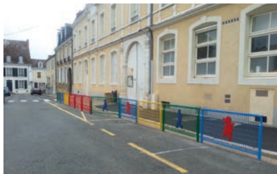
Implantation des barrières