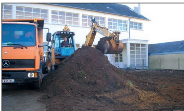
Création d'un parking à l'école élémentaire côté rue Brombacher