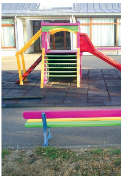
Nouvelle aire de jeux

La municipalité de Bonnétable a procédé à un certain nombre de travaux dans les écoles maternelle et élémentaire pendant l'année 2015. En application du principe de parité de financement, l'école privée du Sacré-Coeur a bénéficié d'une participation financière de la commune de Bonnétable, pour ses dépenses de fonctionnement.