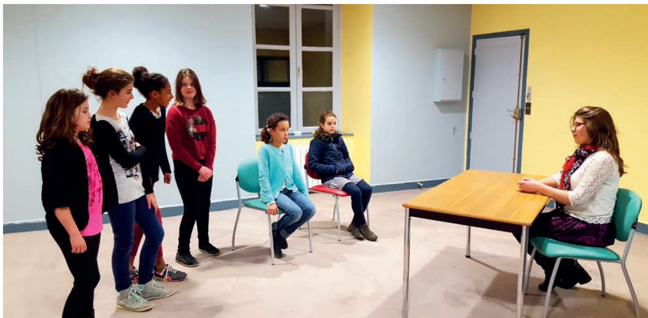
Salle de l'atelier "théâtre" dans la mairie annexe entièrement rénovée par nos services techniques

Un atelier fort intéressant pour ces jeunes enfants et ados, et peut être une future troupe pour accompagner nos amis des "Tréteaux de Malestable" !