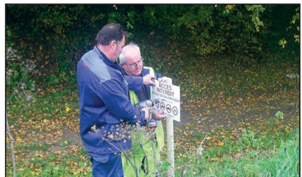
Pose de panneaux dans certains chemins communaux