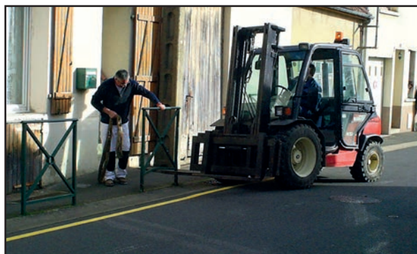
Enlèvement des barrières rue de Rosay