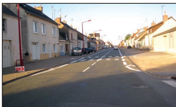
Marquage au sol des bandes cyclables avenue du 11 Novembre