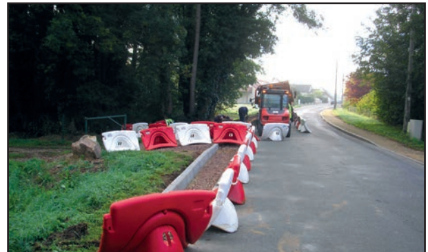
Pose de bordures rue de La Prairie pour créer un passage piétons