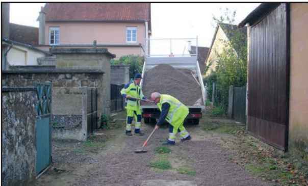
Encaissement dans l'impasse Charles de Gaulle