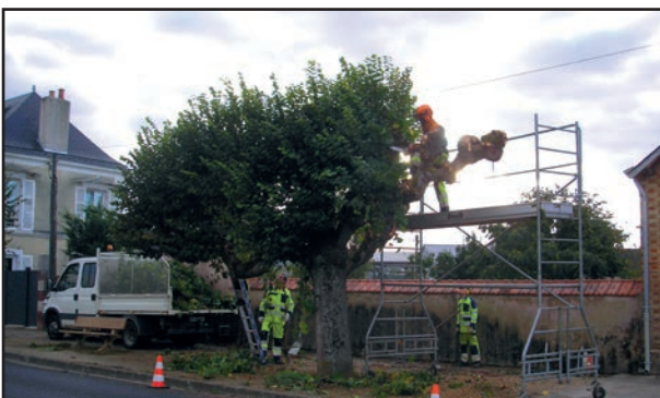
Taille des tilleuls avenue du 8 mai