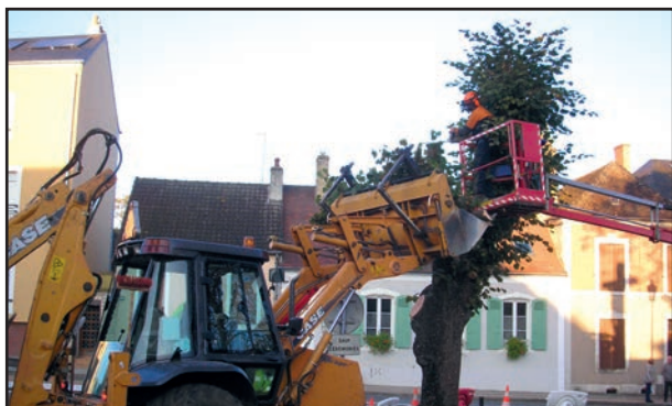
Abattage des arbres devant la mairie