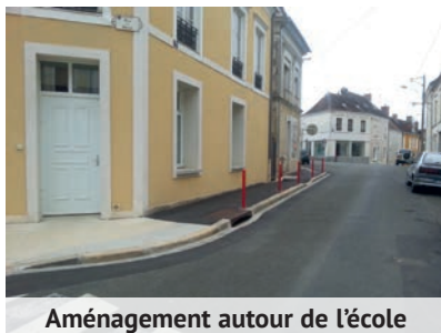
Aménagement autour de l'école

Un équipement similaire est également prévu aux abords de l'école privée.