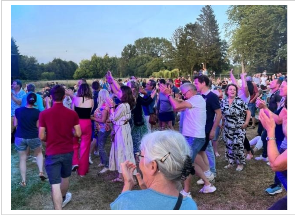
Un public toujours plus nombreux a rythmé les soirées du festival La Bonn'Zik, avant sa dernière édition ce vendredi au parc du château.

www.lemainelibre.fr , vendredi 25 juillet 2025, 181 mots