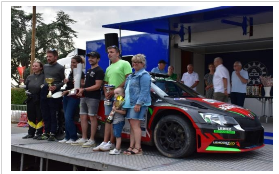
Le 59e podium du Rallye Le Mans