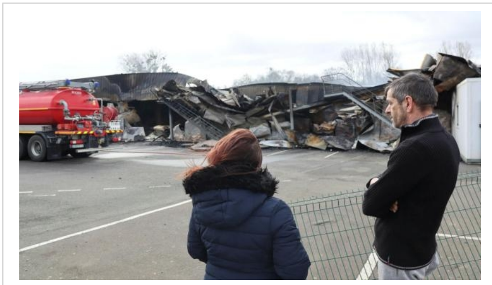
La charcuterie Ruel, à Bonnétable, avait été détruite par un incendie en mars 2023.