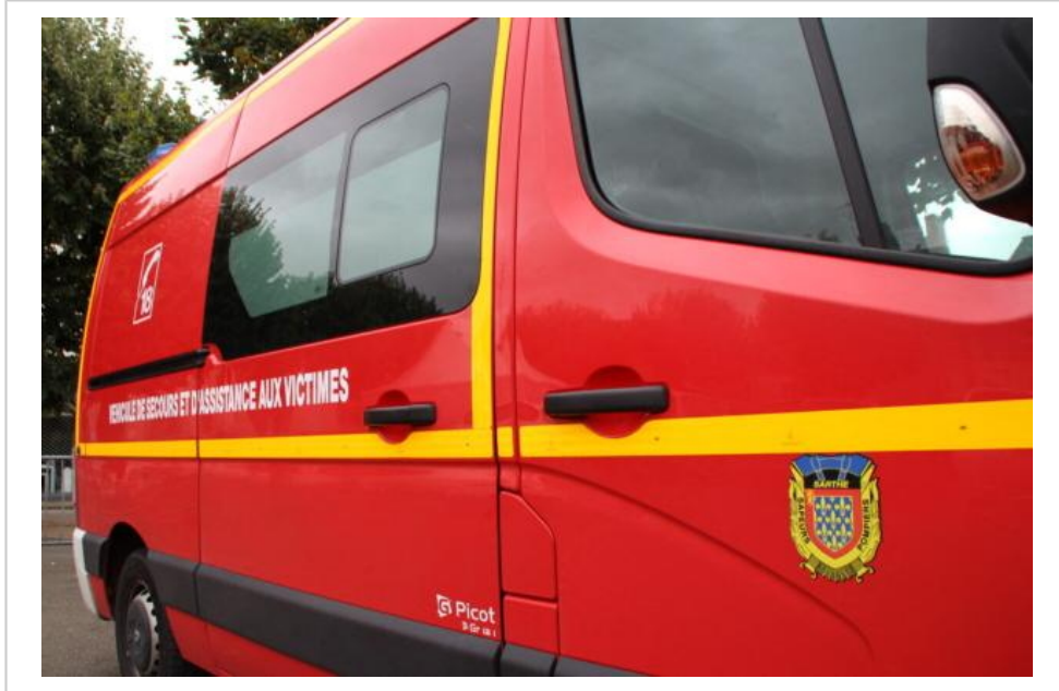
Les pompiers sont intervenus à Bonnétable (Sarthe) pour un accident faisant un blessé grave.

Vendredi 11 juillet, un accident de la circulation routière impliquant un cycliste seul, a fait un blessé grave, à Bonnétable (Sarthe). Il a été transporté au CH Le Mans.