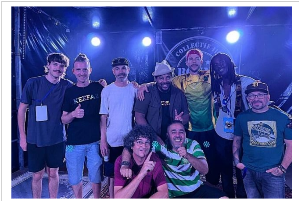
Les artistes de la soirée posent après avoir enflammé La Bonn'Zik devant un public conquis.

Le festival se poursuit avec deux dates à venir. Prochain rendez-vous : vendredi 18 juillet, dès 19 h (concerts à partir de 19 h 30) avec une soirée éclectique : Hugo "Lazy" Mango (chanson de voyage). Trio Gluck (jungle/drum'n'bass acoustique) et Les Saumons Fumés (rock marin punk).