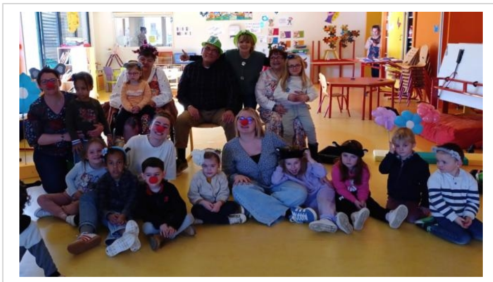
Un moment de partage et de joie entre les enfants et les Saltimbanques du Tarmac.