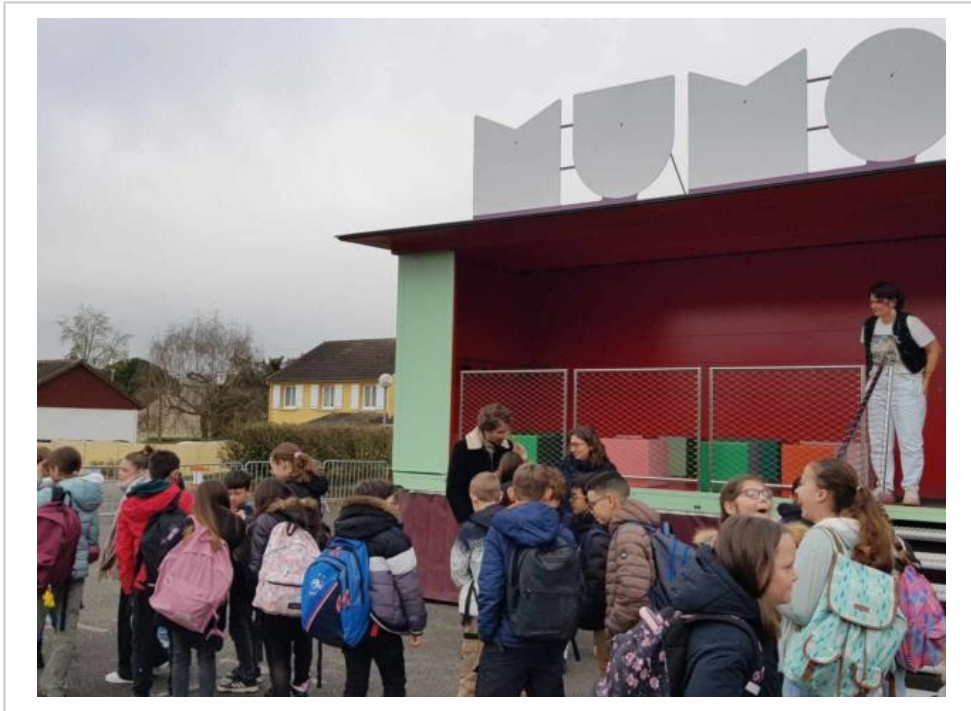
Certains élèves n'avaient jamais approché le monde muséal avant l'escale du MuMo à Bonnetable.