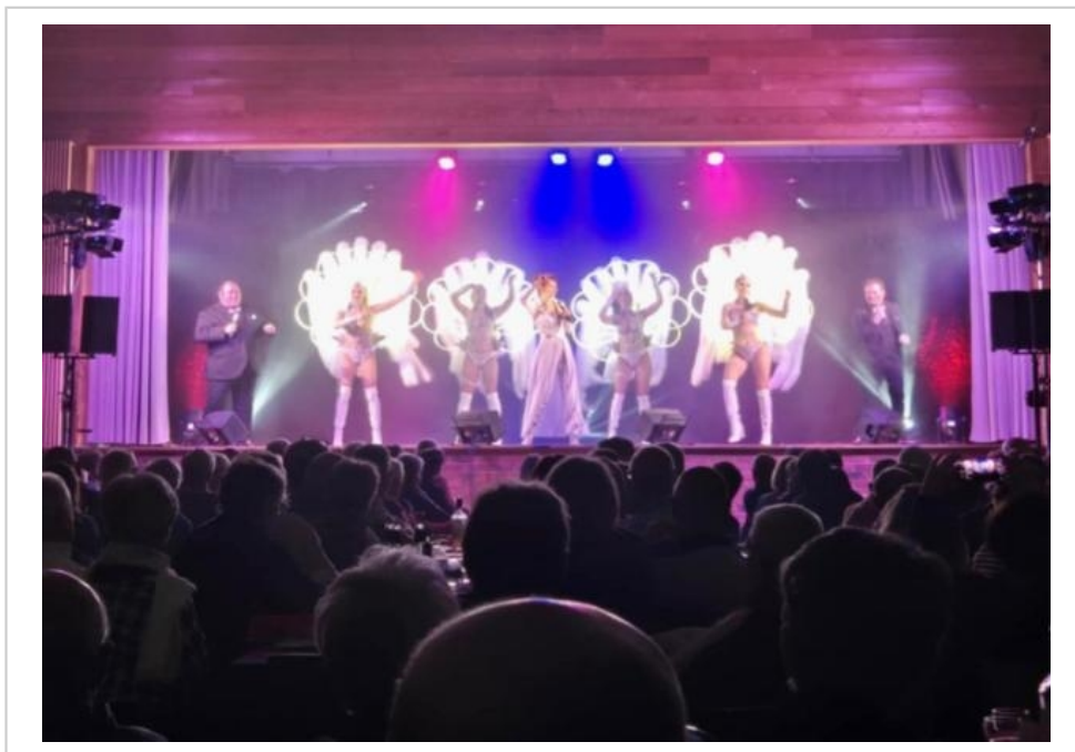
Le traditionnel dîner-spectacle a été une belle réussite.

Dimanche 27 avril : bric-à-brac au jardin public dès 7 heures. Une belle occasion de vider greniers et armoires ou de dénicher des trésors. 1,50 €/mètre linéaire, sans réservation. Restauration et buvette sur place.